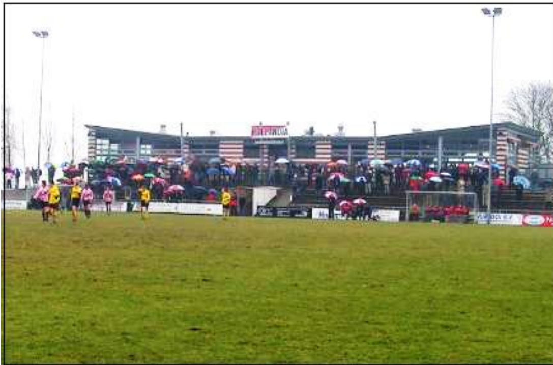
Hollandia, uw vereniging sinds 1898

Tot zover deze nieuwsbrief. (helaas door de herfstvakantie iets later dan gepland, waarvoor excuses). U hoort zeker nog van ons!! NB. U bent de afgelopen maand (per mail) reeds benaderd voor uw bijdrage van €50 voor het seizoen 2015-2016. Wij rekenen op u!!